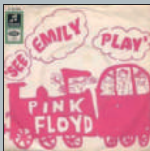
See Emily Play/The Scarecrow 1967 - Columbia DB 8214