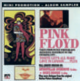
Interstellar Ovrdrive 1968 - Instant Records INLP 002

Nella discografia abbiamo preso in considerazione le stampe originali inglesi a 45 e 33 giri.