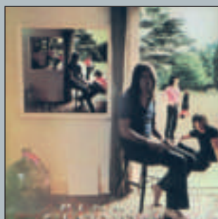
Ummagumma 1969 - Harvest SHDW 1/2