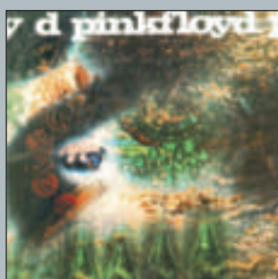
The Piper At The Gates Of Dawn 1967 - Columbia SX 6157