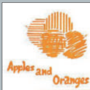
Apples And Oranges/Paint Box 1967 - Columbia DB 8310