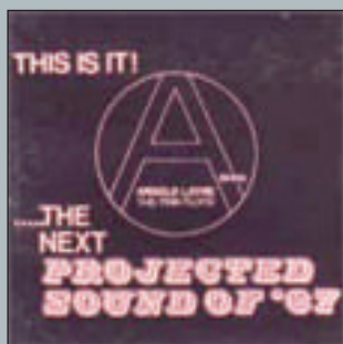
More 1969 - Columbia SCX 6346