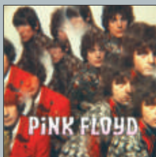
The Piper At The Gates Of Dawn 1967 - Columbia SX 6157