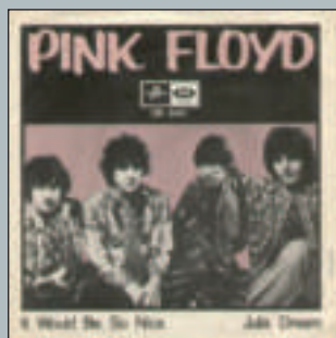
It Would Be So Nice 1968 - Columbia DB 8410